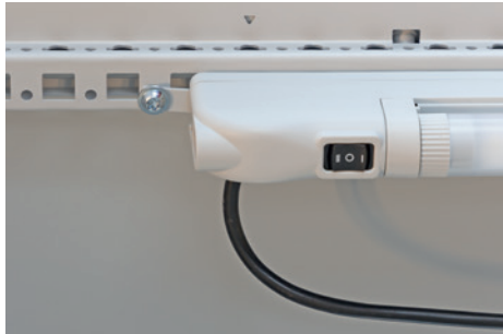
Assembly with screws on profiles and surfaces