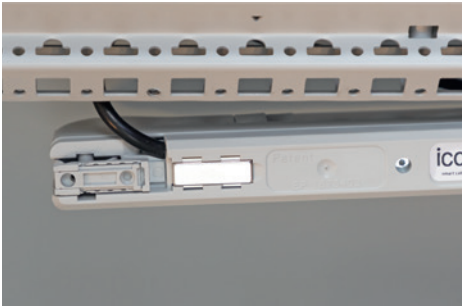
Assembly with integrated magnets