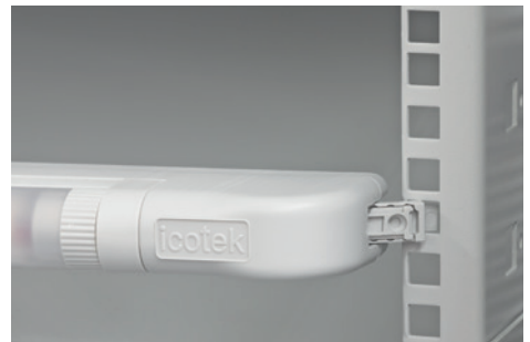
Einrasten im 19" Rack