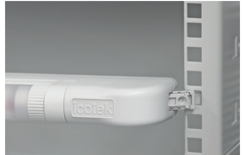
Snap-in assembly in the 19" rack